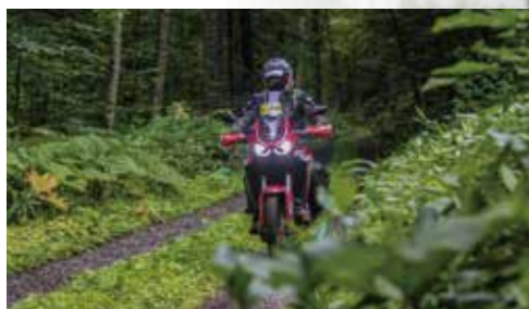
これが「コマ図」と呼ばれるルートマップ。 曲がる所までの距離と簡単な図が書かれている。