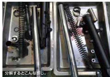
分解するとこんな感じ。

そしてどうせフォークオイルを交換またはオーバーホールするのならオイルを純正よりも粘りの硬いオイルを使うとですね、乗り心地がすごくよくなるんですよ。先日でも走行距離3,000kmのリード125のフォークメンテで、もともと乗り心地も良かったんですが、前ブレーキを強くかけたときにフォークが縮んでゴツン!と底突きする感じがあったのですが、オイルを硬めにしたらからは急ブレーキをかけてもゴツンとなくなりました。道路に出るときに段差を降りたときの感触もとても静かになりましたよ。