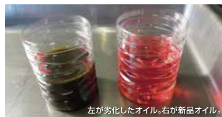
左が劣化したオイル、右が新品オイル。

すが使用済みのフォークオイルは、ねずみ色や黒色でヘドロ状になっていたりします。特に新車から一度もオイル交換やオーバーホールしたことのないフロントフォークのオイルはかなり汚れていますよ。