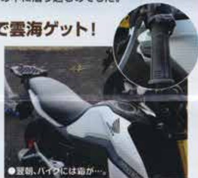
●翌朝、バイクには霜が…。

翌朝、寒さで目が覚めました。よく見るとテントのファスナーを一か所締め忘れていました…。皆の生存確認をする為外に出ると、すでに皆起きていました(笑)。寒さで殆ど寝れなかったという人が大半。ふとバイクに目をやると…凍ってる。。完全に霜降りバイクになっていました(半端ない寒波)。朝食も各々作りませんが、撤収作業もあるのであまりのんびりもできず。ちなみに楽しみにしていた露天風呂ですが、「ぬるい!」と聞いたので湯冷めが怖くて入れませんでした…。荷物を積み込みキャンプ場を後に。やまなみハイウェイを