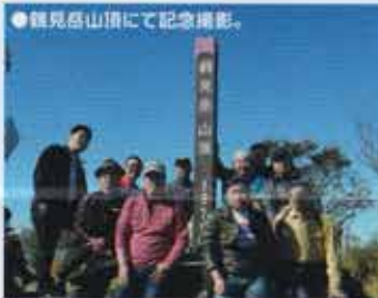
●熊見岳山頂にて記念撮影。

快走、道の駅で弁当を買い込み熊見岳へ。ロープウェイで山頂まで。標高が高くなるにつれ紅葉も色付いてきます。そして山頂駅ではまさかの雲海が僕らをお出迎え!生まれて初めて見る雲海に感動しながら山頂まで少し登山。前日とは違い天候に恵まれ、青空の下、雲の上での昼食タイム。こんな贅沢な昼食は経験したことがありません。