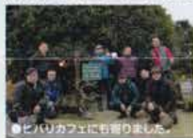
●ピリカカフェにも寄りました。

初日は全く雨が射さない中、完全冬仕様で阿蘇まで走る。皆、過積載車両なのでワインディングは腹8分ぐらいで流す。せっかく阿蘇まで来たんだからとアチコチ寄ってたら時間が!