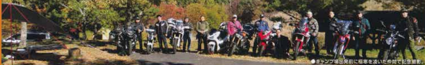
●キャンプ場出発前に極寒を凌いだ仲間と記念撮影。

その後は快走路を繋ぎ北九州まで無事到着。初めてのバイクでキャンプ。経験して失敗することで色々学ぶことができました。一番の教訓は「キャンプ場には早い時間に着く事」ですかね。特にこの時期は日没が早いので気を付けなければ…。正直、バイクキャンプはオートキャンプと違い豪勢にはできないし、積載の問題もあり不便を感じる事もあります。知恵を絞ろうまできた時の喜び、行き帰りの過程なども楽しみ、時には気になる小道に入り込むことができるのは、やはりバイクならではの楽しみだ!パイパスホンダの野遊び小僧(オヤジ)と呼ばれるまで、これからも楽しいイベントをやってほしいと思います!