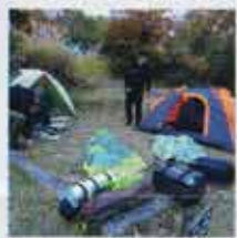
●火を囲んでの団らんがキャンプの醍醐味。

人は凍死を覚悟したそうです(笑)バイクから荷を下ろし、日が暮れる前に慌てて設営。「ビール飲みながら優雅に～」なんて言ってる場合ではない。テント購入後、封さえ開けてなかった僕は取説を見ても設営の仕方が分からない…。大声で弱音を吐きながらテントのポールをカチャカチャしていたら、心優しきベテランキャンパーが手伝ってくれました(笑)。そして待ちに待った食事タイム、という調理タイム。基本、食事は各々で用意。BBQだの鍋だの言っても、バイクなので大きな道具をもって来れないので、ここも経験で大きく差が。ベテランほど出来合いの物を用意、中には自宅でシチューを作り、冷凍して持ってきた方も!初心者ほど難しい事をしたり(笑)夢だけは大きい。「餃子と炒飯で今宵は中華パーティーや～!」って。誰とは言いませんが、ノッポで坊主でメガネの人です(笑)。家で食べればなんちゃい物でも、大自然の月明かりの下で食べると唸るほどに美味しい!米を炊けた事に喜び、火のありがたさが