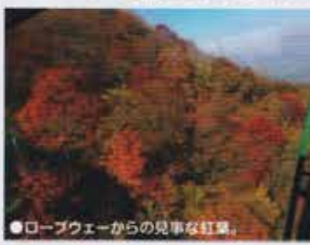
●ロープウェイからの見事な紅葉。